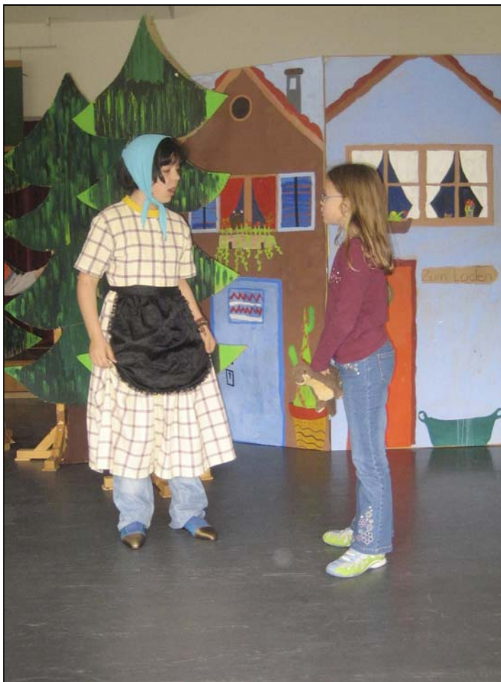
„Der Räuber Knatter-Ratter“ Singspiel 3. Klasse Mittwoch, 21. Mai 2008 (☛ Seite 3)

Schulhaus Meiliwiese, Kindergarten Meiliwiese, Kindergarten Fröschlezzen