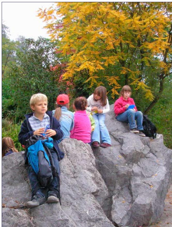
Herbstanfang auch im Zücher Zoo (s. Seite 2)