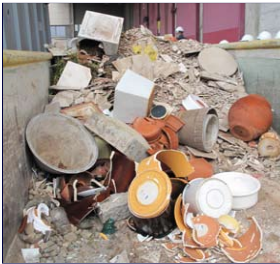
Was da nicht alles fortgeworfen wird....

Dort angekommen, waren alle schon überwältigt von den vielen Lastwagen voller Müll und konnten die Führung kaum erwarten.