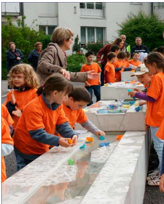
Das Kunstwerk wurde von Daniele Trebuchci gestaltet.