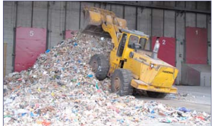
Meterhoch türmen sich die Abfallberge!

Nach der interessanten Führung mit Herrn Schroffenegger bekamen alle Kinder die Gelegenheit, ihr neu erworbenes Wissen im Rahmen eines Wettbewerbs der KEZO unter Beweis zu stellen.