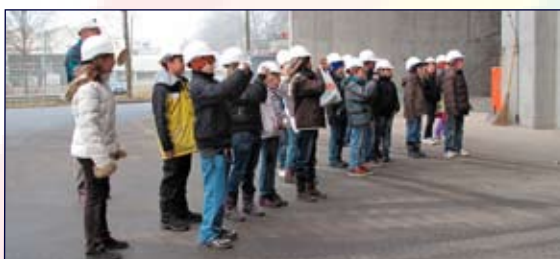
Kluge Köpfe schützen sich.

Bevor es aber so weit war, musste für die obligatorische Sicherheit gesorgt werden. So bekamen alle Kinder sowie Führungs- und Lehrpersonen einen weissen Helm auf den Kopf gesetzt. Nun konnte der spannende und sehr lehrreiche Rundgang beginnen.