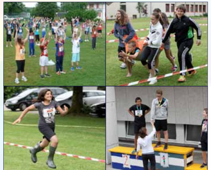
Voller Einsatz aller Beteiligten!

Nach zweimaliger Verschiebung konnte der Meiliwiese Mittelstufensporttag am Freitag, 14. Juni 2013, endlich bei trockenem Wetter durchgeführt werden. Die Schülerinnen und Schüler waren mit vollem Einsatz dabei. Herzlichen Dank an alle Helferinnen und Helfer!