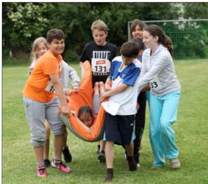
Sporttag der Mittelstufe -> Seite 2