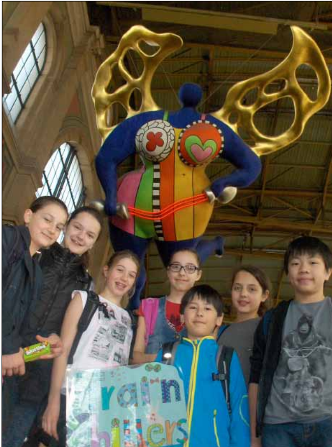
Impression vom Bahntag der 6. Klasse, 9. April 2015