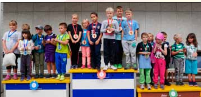
Spiel- und Sportmorgen der Unterstufenklassen (s. S. 2)

Beachten Sie bitte die Startzeiten der Unterrichtslektionen: 08.15 Uhr, 09.00 Uhr, 10.15 Uhr, 11.00 Uhr (fettgedruckt sind die Startzeiten). Wir danken für Ihren pünktlichen Besuch zu den Lektionsanfangszeiten und das interessierte Beobachten des Unterrichtsgeschehens. Gespräche zwischen Besuchern sollen nicht während des Unterrichtes stattfinden. Dafür ist Zeit während der grossen Pause in der Kaffeestube des ElternForums Meiliwiese in der Pausenhalle (Trakt orange). Für noch nicht schulpflichtige Geschwisterkinder organisiert unser ElternForum neu eine «Chinderhüeti» im Trakt blau (Räumlichkeiten Tagesstrukturen). So können sich die Eltern auf die Besuche bei den ABC-Schützlingen freuen. Wir bitten Sie, auf dem gesamten Schulareal auf den Handygebrauch zu verzichten. Danke. Das Schulteam Meiliwiese