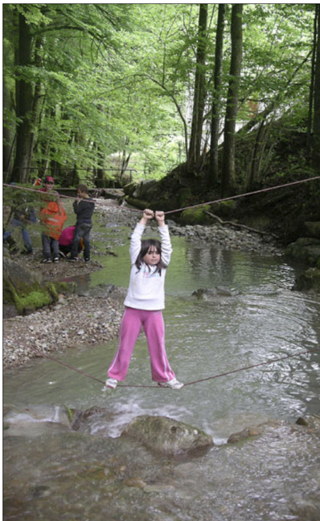
Schulreise 1. Klasse! (☛ Seite 3)

Schulhaus Meiliwiese, Kindergarten Meiliwiese, Kindergarten Fröschlezzen