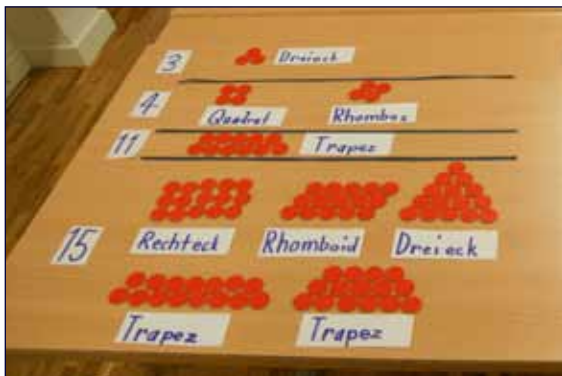
Bei welchen Zahlen gibt es nur eine Form?

Dabei haben wir herausgefunden, dass bei einigen Zahlen nur ein Trapez möglich ist und bei allen andern mehrere Formen vorkommen. Der Drachen kam überhaupt nicht vor.