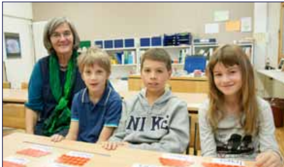
Die Zahlenforscherinnen und -forscher

In der Begabtenförderung haben wir versucht, mit Batzen alle geometrischen Flächen (Dreieck, Quadrat, Rhombus, Rechteck, Rhomboid, Trapez und Drachen) zu legen. Wir begannen mit drei Batzen (gibt ein Dreieck), dann mit vier Batzen (gibt ein Quadrat und einen Rhombus) usw. Mit neun Batzen gab es bereits ein Quadrat, einen Rhombus und zwei verschiedene Trapeze. Anschliessend untersuchten wir alle Zahlen bis 21, jeweils mit allen Möglichkeiten.