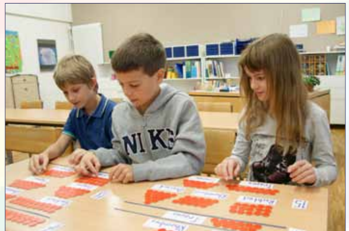
Zahlen in Form bringen und erforschen

die Mittelstufenklassen den Pfäffikersee umrunden und erst gegen Morgen wieder in Hinwil eintreffen werden. Für warme Verpflegung ist gesorgt. Genauere Informationen folgen. Wir freuen uns auf diese besondere Nacht mit den Schülerinnen und Schülern!