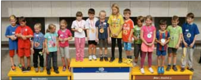
Spieltag Unterstufe: Die Siegerteams