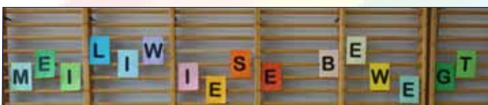
Eindrückliches aus der Projektwoche (s. Seite 3)