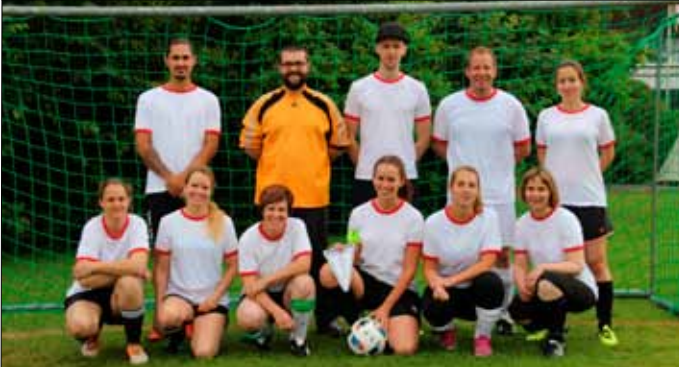
Farbenfroher Meilwiese - EURO 2016 - Match