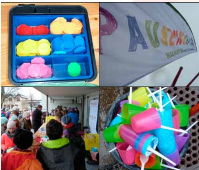
Eindrücke vom dritten Pausenkiosk am 31. Januar 2017