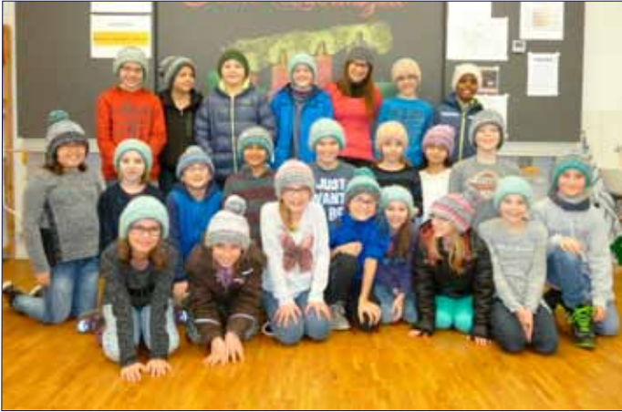
Viele viele bunte Mützen (s. Seite 2)