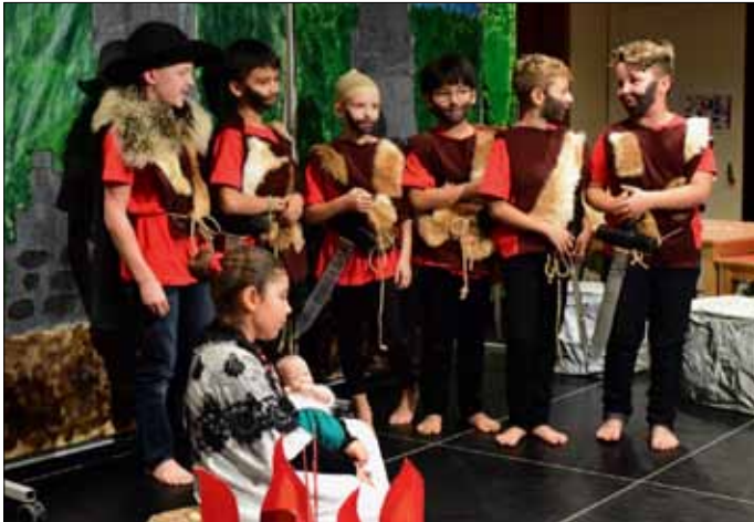
Räuber in der Meiliwiese (s. Seite 2)