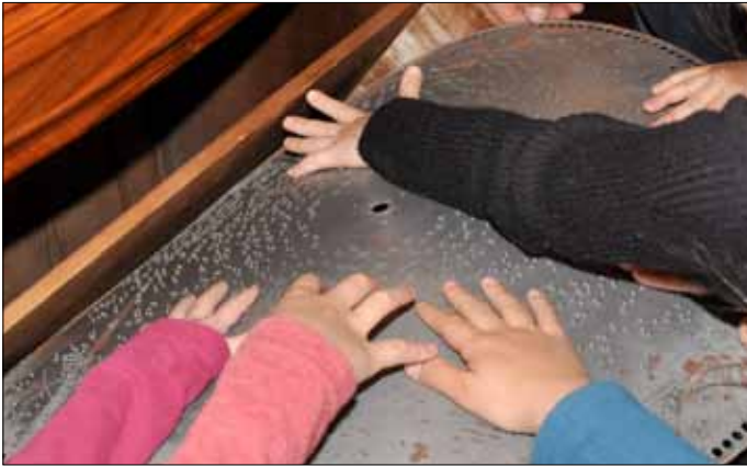
Klangerlebnis der 1. Klasse (s. Seite 3)