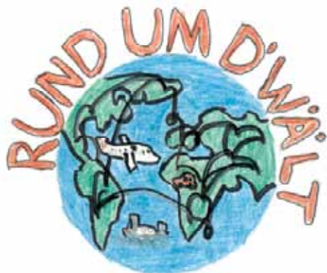
(Zeichnung: Absharan Premachandran, 5. Klasse)

Wir werden Sie mit Liedern, Tänzen und musikalischen Darbietungen «Rund um d'Wält» entführen. Seit Wochen üben die Meiliwiesekinder bereits für dieses besondere Highlight.