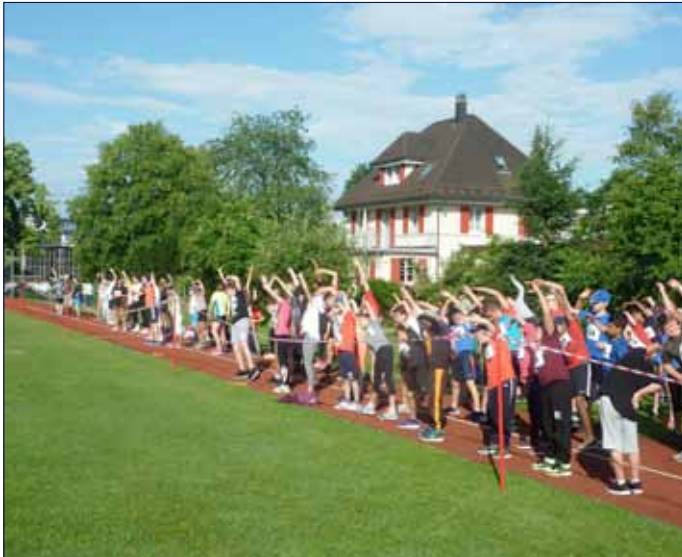
Tolle Leistungen am Sporttag der Mittelstufe (s. Seite 2)