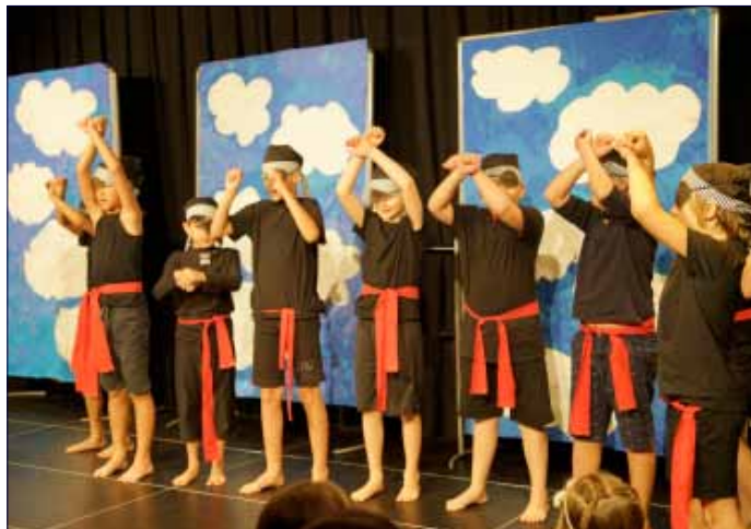
Wünsch dir was... (s. Seite 3)