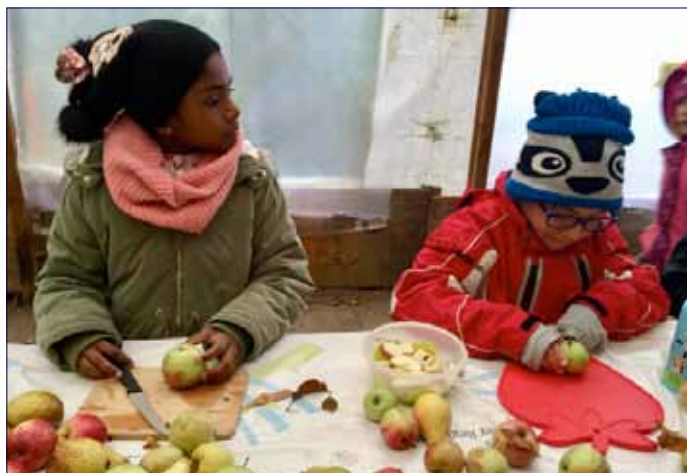
Meilimoscht... (s. Seite 1)