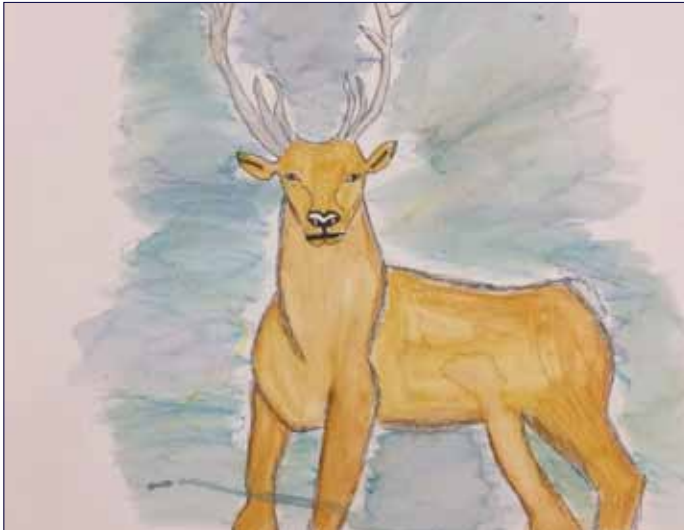
Vorschau «Projekttag im Wald» (s. Seite 2)