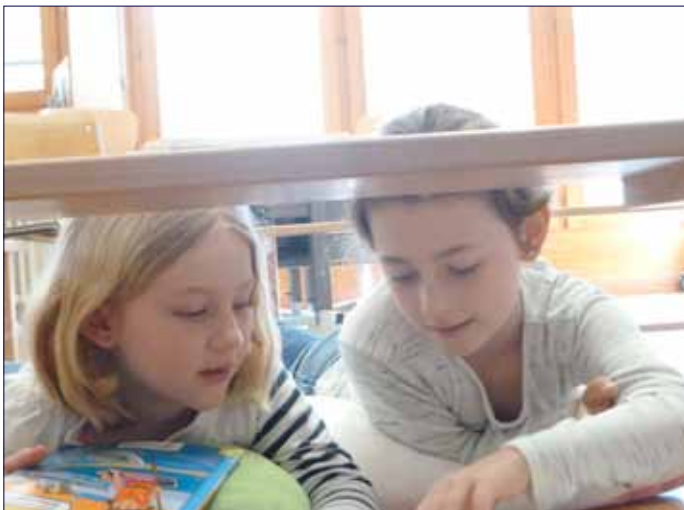
Lesen heisst auf Wolken liegen (s. Seite 3)